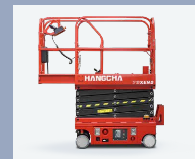
Plattform mit Erweiterung