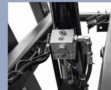
Explosionsschutz Ventil zum Schutz vor Unfällen bei Ölaustritt