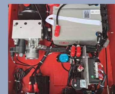
Einfacher Zugriff auf alle Teile bei der Wartung